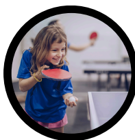
PING 4/8 ANS