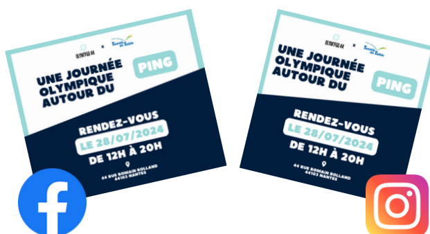
Posts réseaux sociaux

Ensuite à vous de jouer, organisez votre événement, en intérieur ou en extérieur, seul ou dans le cadre d'une journée sportive au sein de votre commune.